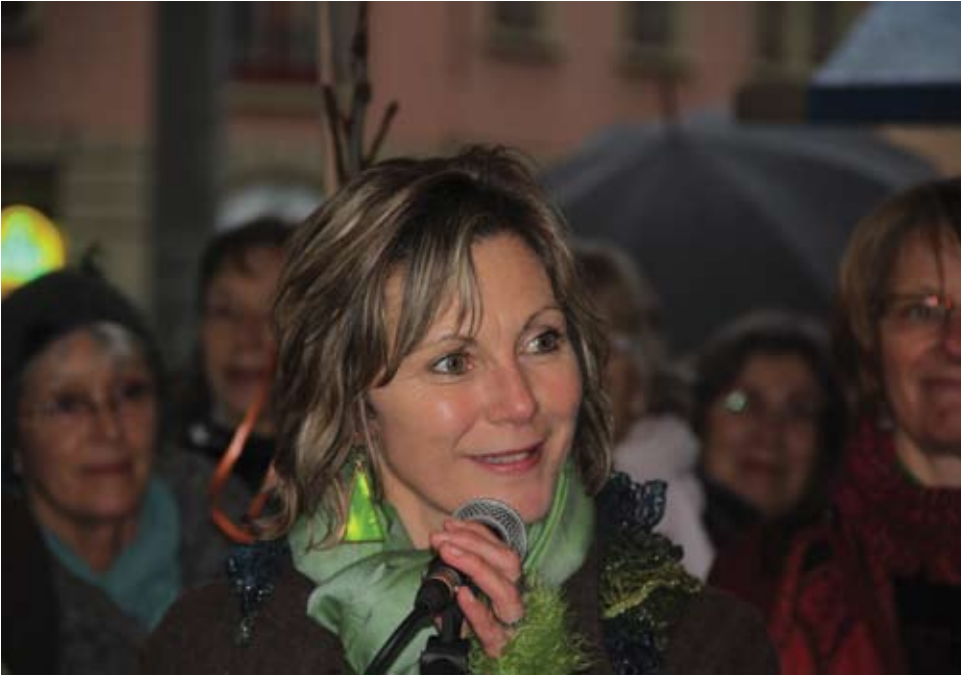
Ansprache von Maya Graf, Nationalratspräsidentin Notre hôte de marque: Maya Graf, présidente du Conseil national