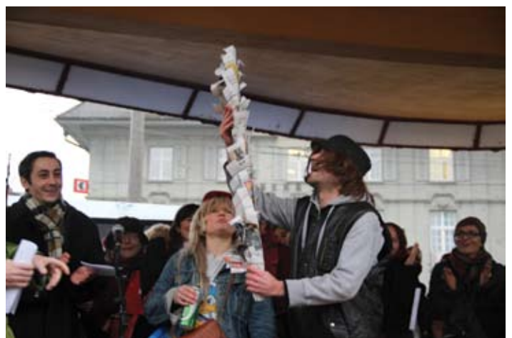
Cabaret und symbolischer Baum