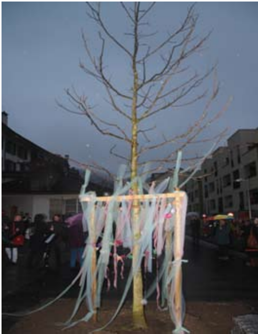
Geschmückter Baum mit Publikum / Le noyer décoré et son public